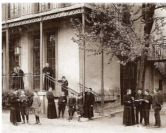
Le Centre Ozanam en 1904...

Établissement catholique fondé en 1881 par l'abbé Girodon, le Centre Scolaire Ozanam s'est depuis lors efforcé, au travers des péripéties qui ont émaillé sa longue histoire, de rester fidèle à l'esprit de celui dont il porte le nom.