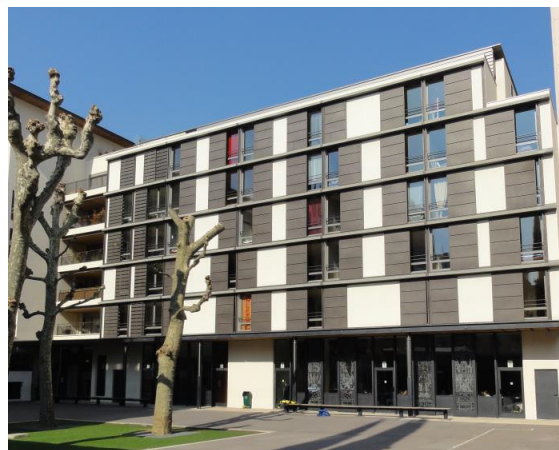
... et après les travaux de reconstruction de 2005

C'est ainsi que depuis plus de 130 ans notre établissement s'efforce d'offrir aux élèves qui le fréquentent un cadre propice à leur épanouissement personnel et scolaire :