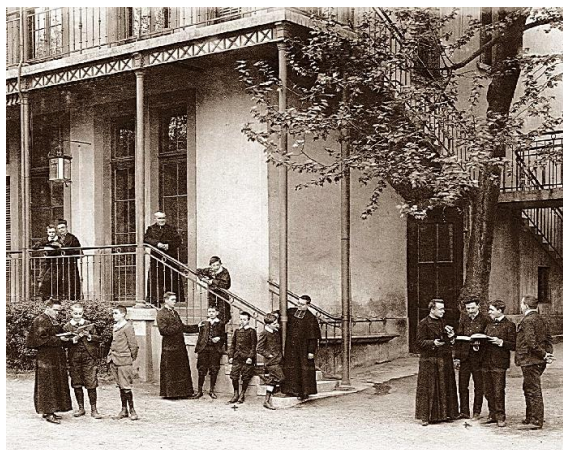
Le Centre Ozanam en 1904...

Établissement catholique fondé en 1881 par l'abbé Girodon, le Centre Scolaire Ozanam s'est depuis lors efforcé, au travers des péripéties qui ont émaillé sa longue histoire, de rester fidèle à l'esprit de celui dont il porte le nom.