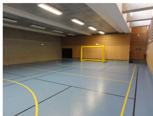
L'oratoire et le gymnase